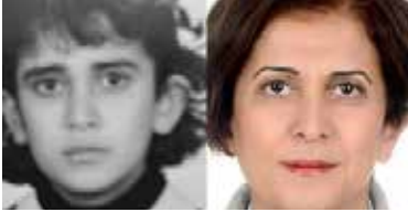
Sevinç Pehlivan Sütü