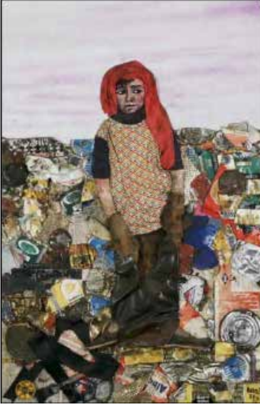
Resim 2. Antonio Berni, "Juanito Laguna", 1978, Houston Güzel Sanatlar Müzesi