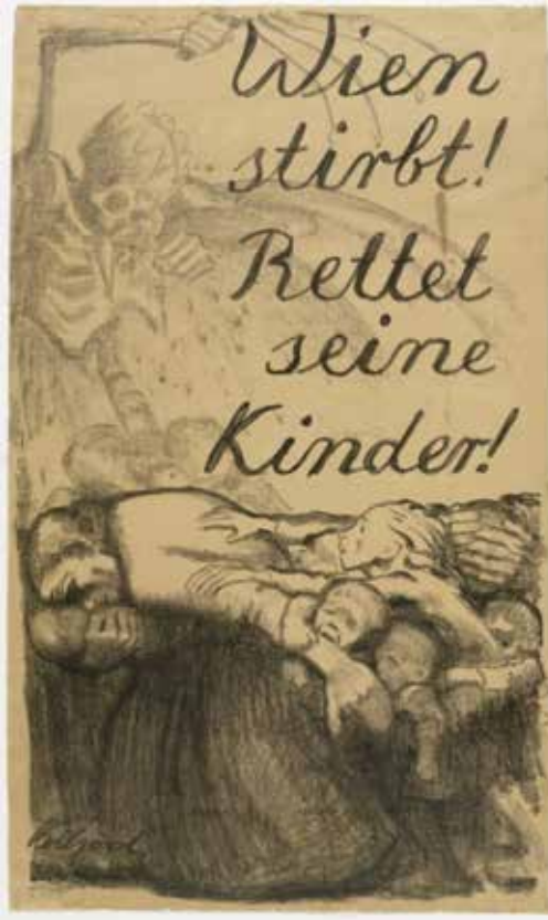
Resim 1. Käthe Kollwitz, Viyana Ölüyor! Çocuklarını Kurtar!, 1920, Özel Koleksiyon

dönemindeki politik hareketleri yakından takip etmiştir. Kollwitz, sanatsal çalışmalarının ilk dönemlerinde edebi yöne ağırlık vererek portreler üzerinde durmuş ve sosyal sorunlara mesafeli bir “sanat, sanat içindir” anlayışını benimsemiştir. Doktor olan eşinin muayenesine gelen işçi sınıfından hastalarla karşılaşması ve 1. Dünya Savaşı’na gönüllü olarak katılan oğlunu kaybetmesi çalışmalarında sosyal bir duruş sergilemesine neden olmuştur. Bu yüzden Kollwitz, sınıf sorunları, açlık, yoksulluk, savaş, barışseverlik ve çocuklar gibi konulara dışavurumcu bir açıdan eserlerinde sıkça yer vermiştir (Ayan, 2008, s.34-35). 1912 yılında “Büyük Berlin İçin” adlı çalışmasının içeriğinde her odada beş kişinin yaşadığı ve yüzlerce çocuğun oyun alanlarından yoksun kaldığı 600.000 nüfuslu Berlin’in sınıf farkını orta koymuştur. Ancak Berlin komiseri bunu sınıflar arası nefreti körüklediği gerekçesiyle kaldırmıştır (Ayan, 2008, s.45).