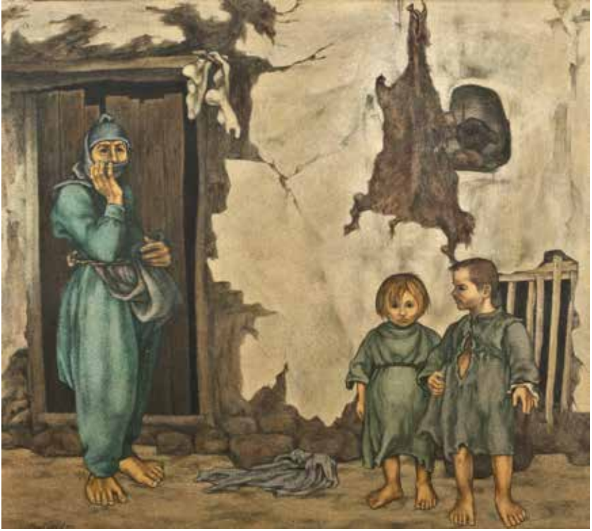
Resim 3. Neşet Günel, Kapı Önü IV, 1977, Özel Koleksiyon

yıl olmuştur. Savaşın neden olduğu ekonomik sıkıntılar, tek parti ve Milli Şef yönetimindeki Türkiye için sancılı günler yaşatmıştır. Devletin ülkede toplumsal adalet ve ekonomik dengeyi sağlayamamasından ötürü kent soylu ile varlıklı kesim, köylü ile işçi sınıfı arasındaki çelişkiler daha da görünür hale gelmiştir. 1940-50 yılları arasında ağırlıklı olarak devletçi karma ekonomi yasa ve ilkelerle çağdaşlaşma, uluslaşma ve demokratlaşma yolunda ilerlemek isteyen Milli Şef yönetimi, 1946'da çok partiye geçişin önünü açmıştır. 1950'de Demokrat Parti'de Bayar-Menderes liderliğinde gelişen çok partili döneme geçişte liberalleşme ereğine karşın, devletin gücünü bırakmamak istememesi 27 Mayıs 1960 Darbesi'ne neden olup Türkiye için yeni yönetimin kapılarını açmıştır (Berksoy, 1998, s.112-13). Öte taraftan, 1950'li yıllardan sonra bireysellik kavramı öne çıkmıştır. Kültürel yaşama bakıldığında 1950-60 yılları arasında birçok düşünce akımlarının sağlı ve sollu irdelenmeye çalışıldığı kaotik sürecin izleri görülmektedir. Düşünce yaşamında da bu kaotik görünümünün sosyoekonomik bağlantıları